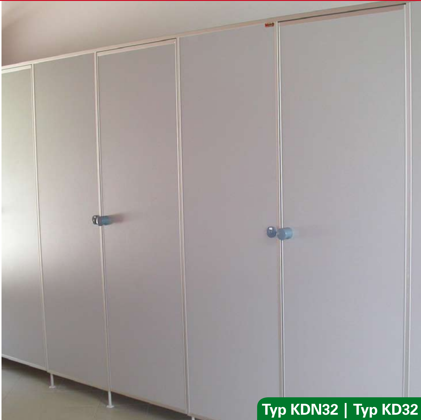
Typ KDN32 | Typ KD32